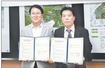
서구보건소와 중앙공원사업소의 협약체결 모습.

공원 입구에서 매점에 이르는 약 800m의 산책로에는 건강표지판을 설치해 이곳을 찾는 시민들에게 건강생활 실천 의지를 북돋을 계획이다. 또 앞으로도 이같은 방안 마련에 상호 협력하기로 했다.