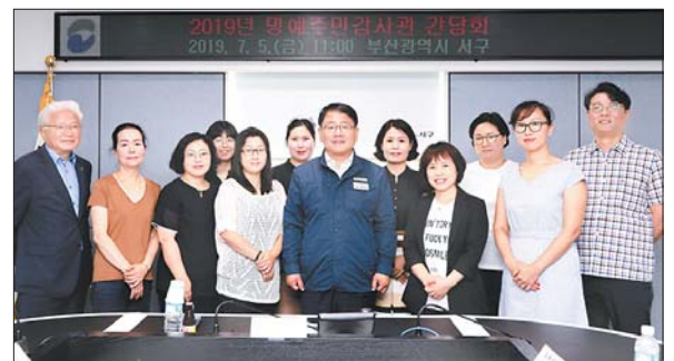
사진은 명예주민감사관 간담회 참석자들 모습.

서구는 지난 7월 5일 서관 재난상황실에서 구정업무의 투명성 강화와 구민 권익 신장 등을 위해 운영하고 있는 명예주민감사관 간담회를 가졌다.