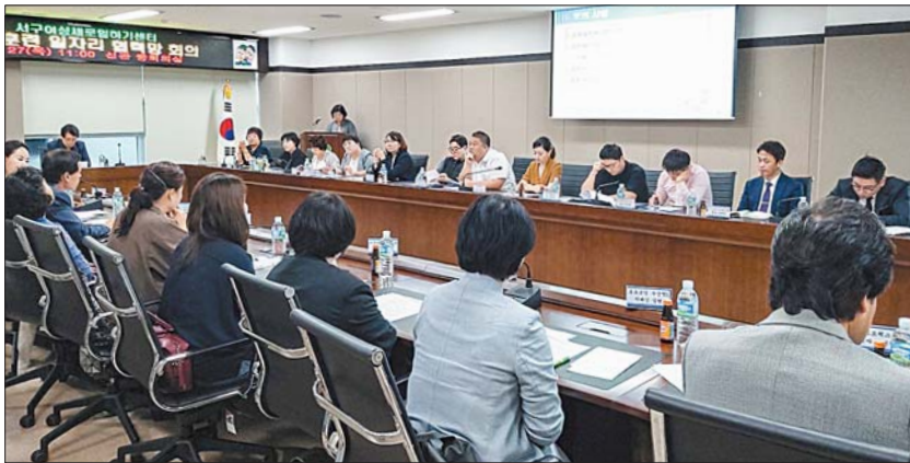
사진은 지난 6월 27일 개최된 직업교육훈련 일자리협력망 회의 모습.

채용관’ 운영을 통해 수료생과 구인기업 간 현장 채용면접을 실시하고 있으며 여성 취·창업박람회에도 적극 참가하고 있다. 또 주 1~2회 구인정보 제공 및 취업상담(자기소개서 피드백), 동행 면접, 취업동아리 운영 등 정기적인 사후 관리 및 취업 연계활동을 펼치고 있다.