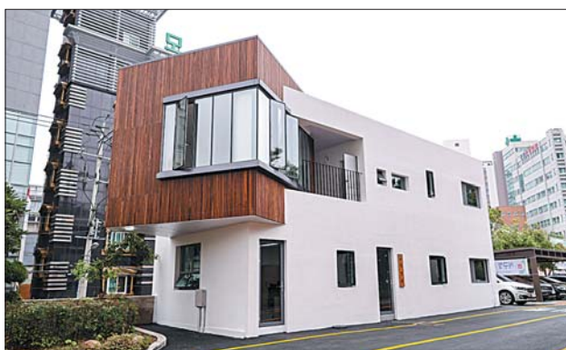
사진은 신축 서구청 목민관 모습.

목민관은 기존 당직실이 낡고 협소해 열악한 근무환경에 대한 개선의 목소리가 높았던 데다가 오는 8월부터 본격적으로 시행되는 여직원