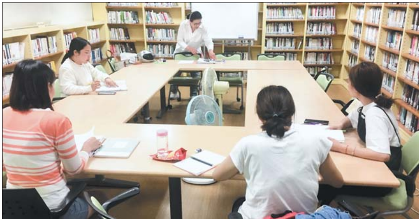
사진은 ‘결혼이민자 한국어능력시험교실’ 수업 모습.

우선 가장 큰 고민인 한국어 습득을 위해 지난 5월부터 매주 화요일 ‘결혼이민자 한국어능력시험 교실’을 운영하고 있는데 오는 10월에는 시험에도 도전할 계획이다. 한국어교실은 자녀들에게도 별