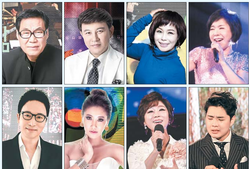
사진은 오는 8월 4일 축하공연을 펼치는 조영남, 설운도, 현숙, 최진희, 아이돌그룹 느와르, 2018년 대상 수상자 최대성, 문희옥, 서지오, 김중환(사진 왼쪽부터 시계방향).

초청가수 소유찬·소유미·리아킴·정다한·구수경·행숙이·향기·손빈아·천운·황후가 분위기를 띄울 예정이다.