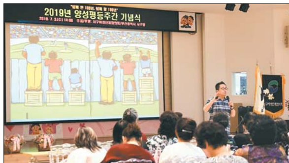
사진은 지난 7월 3일 개최된 양성평등주간 기념행사 모습.

‘평등을 일상으로 : 함께한 100년, 함께할 100년’을 슬로건으로 마련된 이날 행사에서는 유공자 표창과 관련 동영상 상영 등을 통해 양성평등 인식 확산과 일·가정 양립 분위기 조성의 계기를 마련했다. 기념식이 끝난 뒤에는 동아대 통기타동아