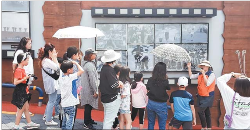
사진은 최민식 작가의 사진으로 꾸며진 아미동 입구 골목갤러리 방문객들 모습.

실제 비석문화마을 방문객수는 크게 늘었다. 아미동 젊은 엄마들의 모임인 아미맘스가 운영하는 기차집카페가 단적인 예이다. 기차집카페의 경우 한 달에 20명 남짓하던 개별 방문객이 최근 3배 가까이 늘었다. 단체 방문객은 폭발적으