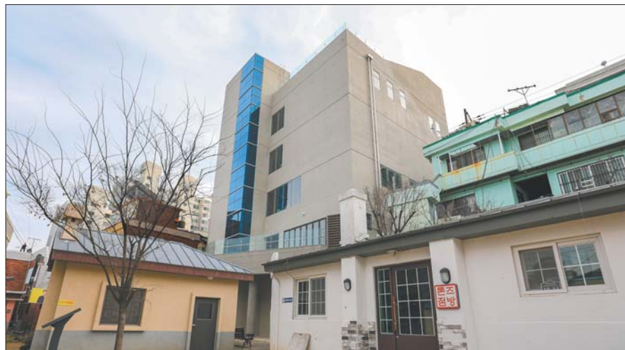
사진은 내년 1월 14일 개관하는 이태석 신부 기념관(가운데)과 생가(왼쪽), 톤즈점방 모습.

기념관은 이 신부가 몸담았던 한국천주교살레시오회에서 운영을 맡아 다양한 사업과 행사를 통해 ‘섬김’, ‘기쁨’, ‘나눔’ 등 그의 3대 정신을 계승·발전시키는 거점역할을 하게 된다. ‘섬김’의 정신은 청소년