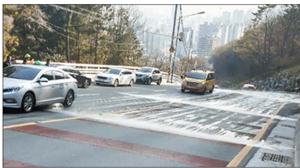
사진은 자동염수분사장치에서 염수가 뿜어져 나오고 있는 모습.

엄광산 자락인 이 일대는 평지보다 기온이 3~4℃ 가량 낮은데다 도로가 급경사를 이루고 있는 관내 대표적인 제설취약지역이다. 겨울철이면 적은 양의 눈·비에다 도로결빙 현상이 나타나 안전사고 발생 위험이 높을 뿐 아니라 차량통제로 인해 꽃마을 주민이나 방문객들이 발이 묶이는 불편과 피해를 입고 있는 실정이다. 지난 겨울에도 도로결빙으로 차량운행이 통제되면서 꽃마을에 위치한 유치원의 원생 300여 명이 제때 귀가하지 못하