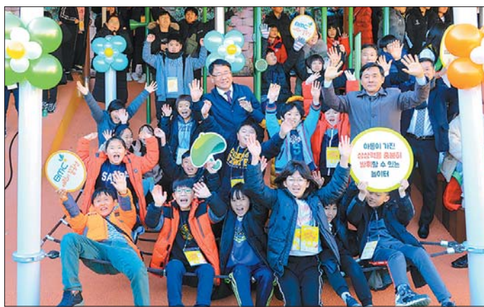
사진은 놀이터 오픈식에 참석한 내빈들과 아이들의 기념촬영 모습.

초록우산어린이재단은 놀이터 구성에 앞서 전교생(93명)과 교사, 학부모가 참여한 가운데 아동권리교육(총 20회)을 실시하는가 하면 3~6학년생 16명으로 구성된 어린이 디자이너들을 디자인워크숍(총 7회)에 참여시켰다.