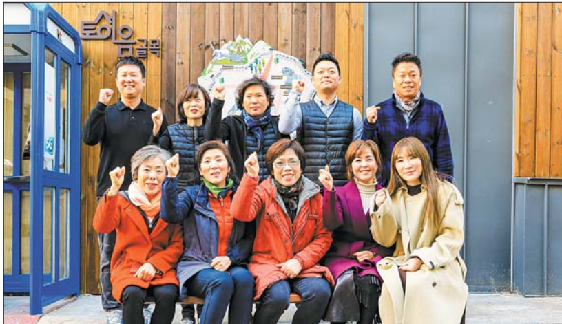
사진은 ‘토성이음골목’ 상가 상인들이 포토존에서 파이팅을 외치고 있는 모습.

이번 사업의 또 다른 성과는 상인들의 인식 변화다. 사업 추진에 앞서 14개 가게의 상인들은 골목공동체를 만들었고, 머리를 맞대는 과정에서 변화의 중요성을 인식하기 시작했다. 그 결과 일부 가게에서는 자부담으로 출입문의 시트지를 바