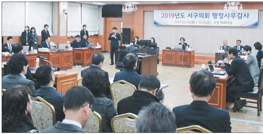
사진은 지난 11월 28일부터 12월 6일까지 진행된 행정사무감사 모습.