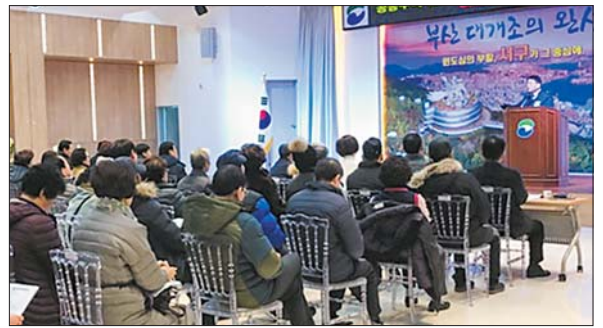
사진은 공동주택 관리 관계자 교육 모습.

서구는 지난 12월 6일 신관 4층 다목적홀에서 의무관리대상 공동주택 관리 관계자 100여 명이 참석한 가운데 ‘2019년 공동주택 관리 관계자 교육’을 실시했다.