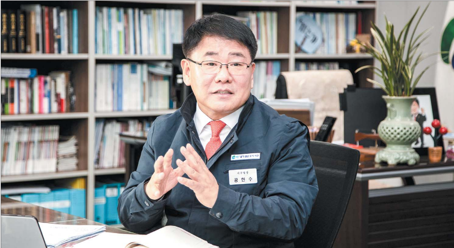
공한수 구청장이 2019년 구정 성과와 내년 구정 운영 방향 등에 대해 밝히고 있다.

지난 1년 간 구정에 대한 사랑과 협조, 성원을 아끼지 않으신 11만 구민 여러분과 저와 함께 역동적으로 구정 운영에 임해 준 600여 직원들에게 이 자리를 빌려 감사드립니다.