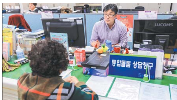
사진은 서대신3동 통합돌봄 상담창구 모습.

이에 따라 통합돌봄 상담창구에는 보건·복지·돌봄 등 관련분야 근무경험이 많은 직원이 배치됐는데 초기상담 과정에서부터 지원 가능한 다양한 서비스를 종합적으로 안내해 누락되는 서비스를 방