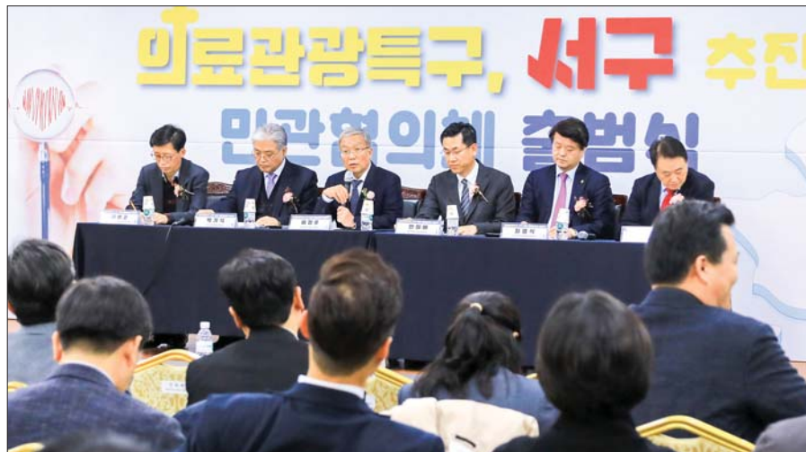
사진은 ‘의료관광특구 서구’ 추진 민관협의체 출범식 자리에서 개최된 토론회 모습.

10년간 부산을 찾은 해외 의료관광객의 30%를 유치했다. 또 최근에는 의료관광 활성화 조례 제정, 대학병원 등과의 의료관광특구 추진 업무협약 체결, 러시아·중국 등 해외 의료관광 설명회 및 팸투어 개최 등 16개 구·군 가운데 가장 활발하게 의료관광특구 추진에 나서고 있다.