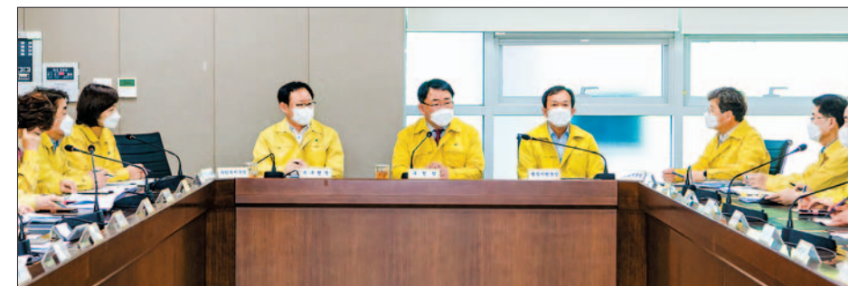
지역경제 활력회복 시책 15건 발굴·추진

코로나19의 지역사회 전파 차단을 위해 새마을단체, 자율방재단 등과 민관 합동 방역소독 작업을 계속해 나가고 있다. 또 방역 전담 인력을 채용해 보건소와 13개 전 동에 배치해 방역소독 작업에 만전을 기하고 있으며, 방역 살수차도 도입해 매일 2회 운영 중이다.