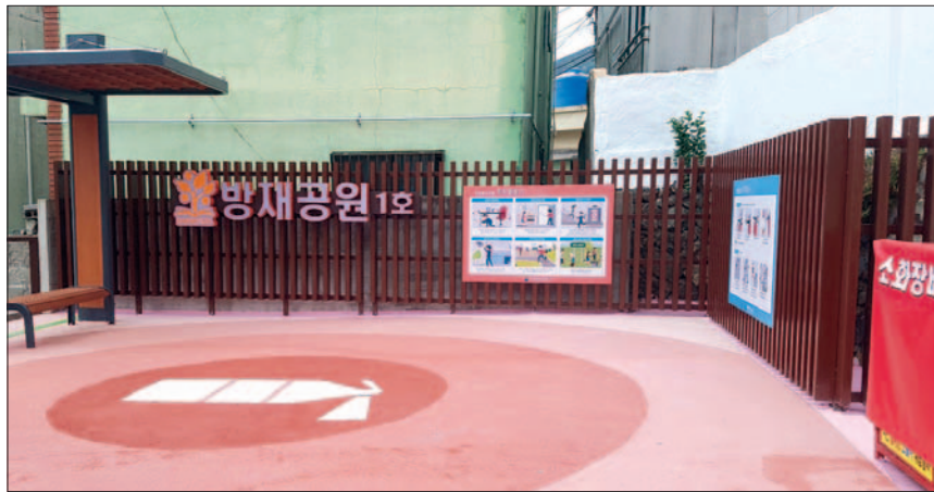
사진은 동대신2동 닥밭골마을에 조성된 방재공원의 모습.

뿐만 아니라 4m 미만 도로가 전체의 88.2%를 차지해 화재 발생 시 소방차와 응급차의 통행이 어려워 2차 안전사고 우려도 높은 실정이다. 실제로 이 일대에서는 지난 5년간 총