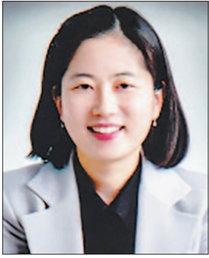
현 안 나