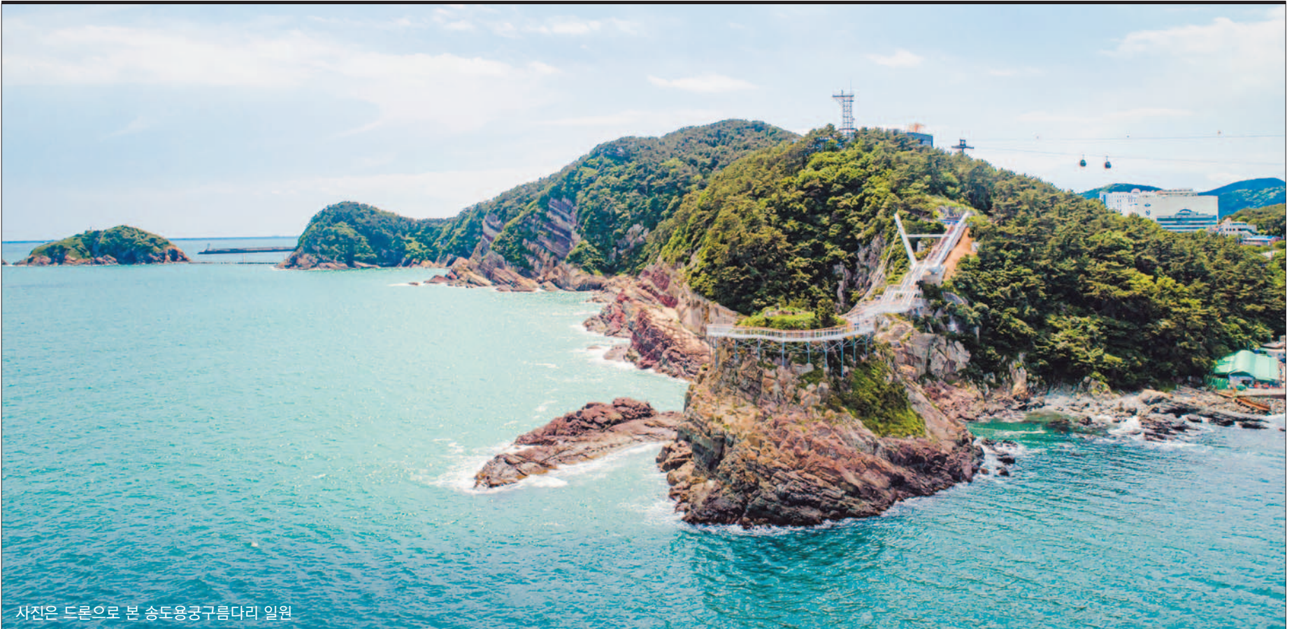
사진은 드론으로 본 송도용궁구름다리 일원