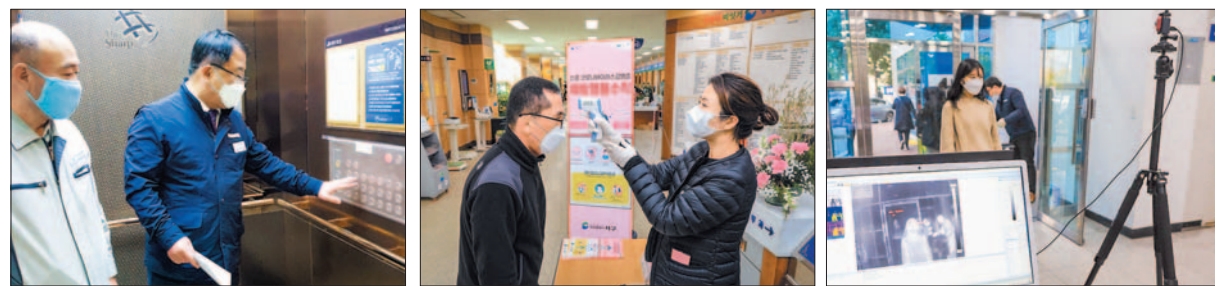
발열감지기 설치, 아파트 승강기 항균필름 보급

코로나19 장기화로 침체된 지역경제 활력회복을 위한 시책 15건을 발굴해 5월부터 본격적으로 추진하고 있다. 서구 주민이 관내 점포를 이용한 뒤 주민센터에 영수증을 제출하면 마스크 1매를 주는 등 소상공인이나 자영업자, 전통시장 상인들을 지원하는 사업이 상당수 포함돼 있다.