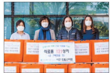
드림스타트 아동 생필품키트 전달 모습.

이번 사업은 아동권리보장원과 (재)플랜한국위원회가 실시한 코로나19 긴급 물품 지원 공모사업에 선정되면서 시작됐다. 서구는 지원 받은 생필품 키트 20개(10만 원 상당)를 조손돌봄가정에 전달하면서 사업비 500만 원으로 생필품 키트