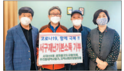
재난기본소득을 기부한 서대신4동 주민들.