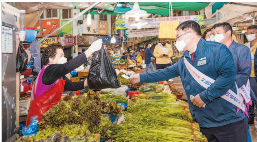
사진은 전통시장 살리기를 위해 중무동새벽시장에서 물건을 구입하고 있는 공한수 구청장 모습.

우선 5월부터 매월 넷째주 수요일 부서별 지정 전통시장에서 장보기를 하는 ‘직원 전통시장 방문의 날’-가는 날이 장날’을 운영하기로 했다. 이를 위해 5월 18일 9개 전통시장