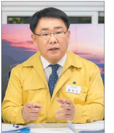
공 한 수 구청장

당연히 구민 안전이다. 코로나19 초반 ‘마스크대란’이 왔을 때 마스크를 구하지 못해 불편과 고통을 겪고 있는 구민들을 위해 백방으로 수소문한 끝에 두 차례에 걸쳐 전 구민들에게 보건용 마스크(KF94)를 배부했다. 또 구민들에게 경제적으로 실질적인 도움을 주고, 나아가 적극적인 소비를 통해서 지역 골목상권을 살리기 위해 전 구민들에게 1인당 5만 원씩 재난기본소득지원금을 지급했다. 구민들이 힘들 때 지체 없이 달려가고, 필요한 때 필요한 지원을 하는 것이 행정의 가장 중요한 역할이다.