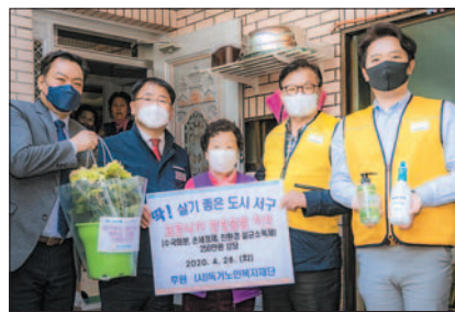
홀몸어르신 힐링물품 전달 모습.

이 행사는 각종 행사 취소 등 코로나19의 직격탄을 맞은 부산지역 화훼농가와 사회적 거리두기 등으로 바깥출입에 제약을 받으면서 우