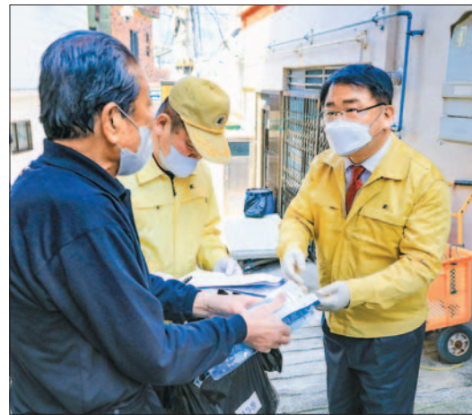
감염취약계층 이어 전 구민 2차례 마스크 배부

‘마스크대란’으로 고통을 겪고 있는 구민들을 위해 1차로 3월 18일 어르신·어린이·임신부·장애인 등 감염취약계층에 보건용 마스크(KF94)와 손소독제를 배부했으며, 2차로 4월 25일 11만 전 구민에게 보건용 마스크를 지원하는 등 마스크 수급난 속에서도 구민 안전을 위해 발 빠르게 대처했다.