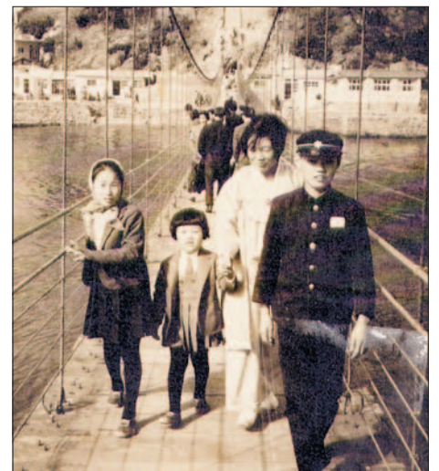
사진은 1960년대 옛 송도구름다리. 가족들이 나들이 나온 모습이 정겹다.