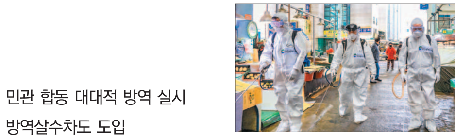
민관 합동 대대적 방역 실시 방역살수차도 도입

코로나19의 지역사회 전파 차단을 위해 새마을단체, 자율방재단 등과 민관 합동 방역소독 작업을 계속해 나가고 있다. 또 방역 전담 인력을 채용해 보건소와 13개 전 동에 배치해 방역소독 작업에 만전을 기하고 있으며, 방역 살수차도 도입해 매일 2회 운영 중이다.