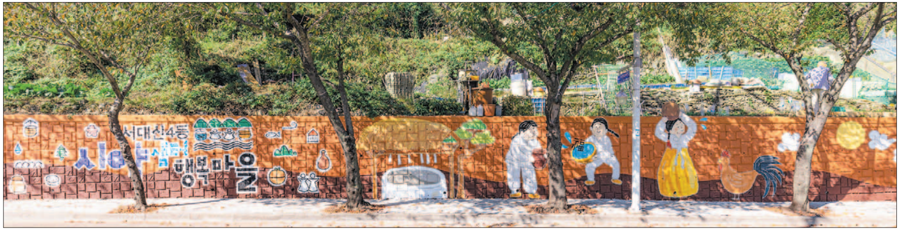
사진은 서대신4동 시약센터마을 입구에 새로 조성된 옹벽 디자인 벽화로 마을이름을 스토리텔링화해 전래동화의 한 장면처럼 꾸며 시선을 사로잡고 있다.