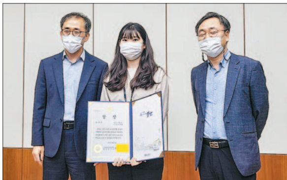
사진은 서구 세무과 직원들의 최우수상 수상 모습.

서구는 이번 최우수상 수상으로 행정안전부가 주관하는 전국 지방세 발전 포럼에 부산대표로 참