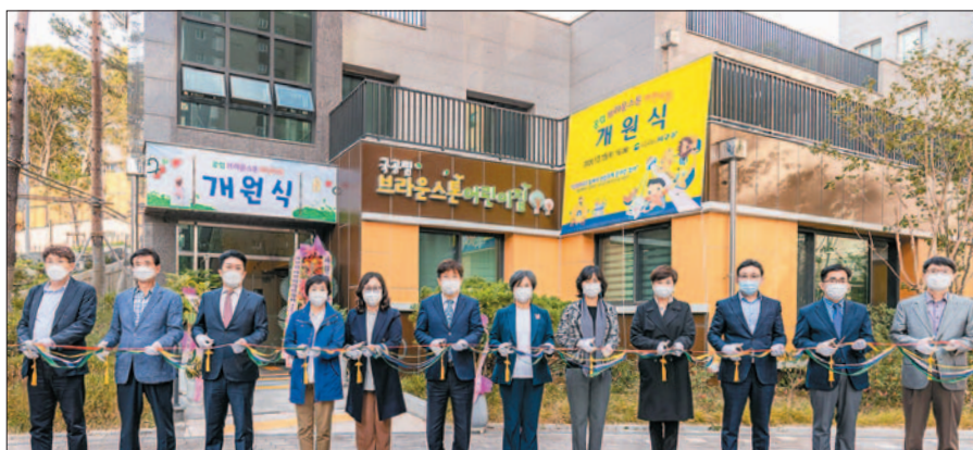
사진은 서구의 14번째 공립 어린이집인 브라운스톤어린이집 개원식 모습.

개원식은 방역지침에 따라 참석 인원을 최소화하는 대신 온라인(밴드) 생중계를 통해 학부모 등도 행사