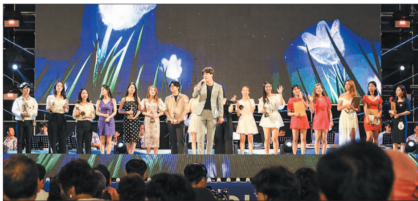
사진은 지난해 현인가요제 대상 수상자의 앵콜 공연 모습.

서구는 코로나19 이후 부산고등어축제 등 지역 축제와 행사를 모두 취소했으나 현인가요제의 경우