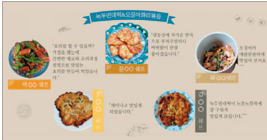
사진은 요리교실 ‘맛남의 클래스’ 참가자들이 직접 만든 요리와 참가소감.

요리교실은 지난 8월부터 11월까지 주 1회 운영되고 있는데 자원봉사자들이 함께하면서 조리과정