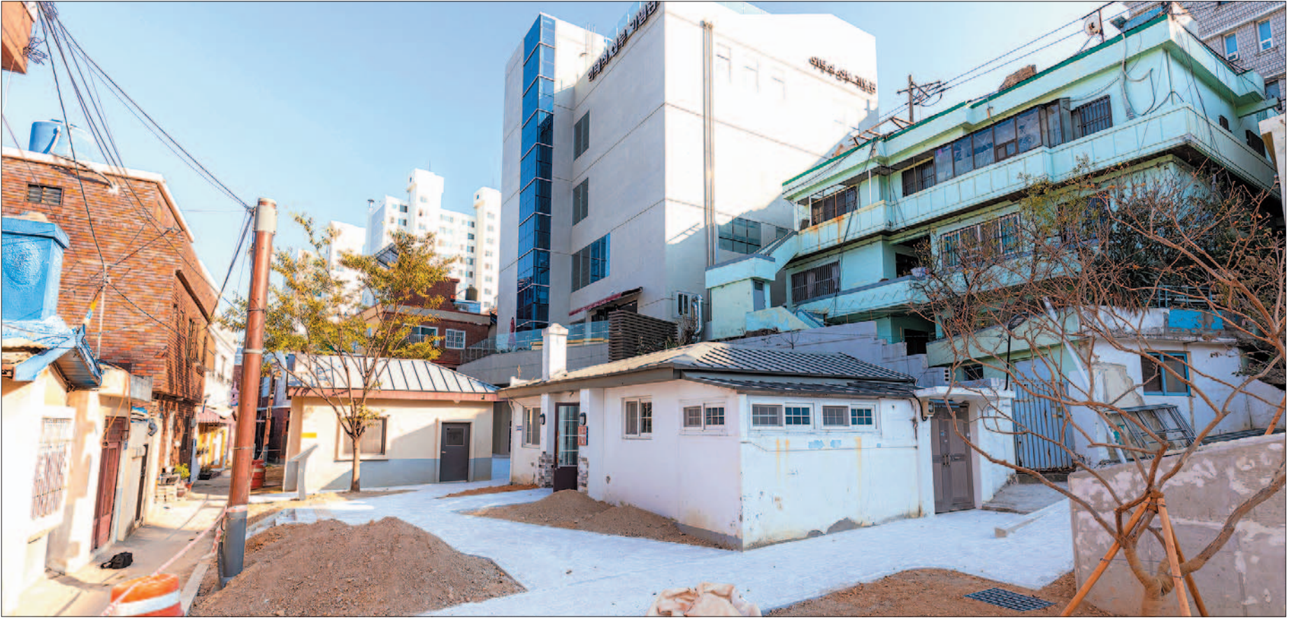
사진은 10월 말 준공을 앞두고 막바지 톤즈문화공원 조성 공사가 한창인 故 이태석 신부 테마의 톤즈빌리지 일원. 왼쪽 작은 건물이 이 신부의 생가, 오른쪽이 톤즈점방이다. 그 뒤로 기념관이 보인다.