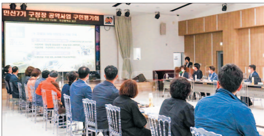
사진은 주민대표와 분야별 전문가로 구성된 민선 7기 공약이행 구민평가단 첫 회의 모습.

분야별 평가에서는 관광분야의 경우 관광 인프라 확충을 긍정적으로 평가하면서 기존 시설과 신규 시설 간의 연결성이나 이동동선 등 운영