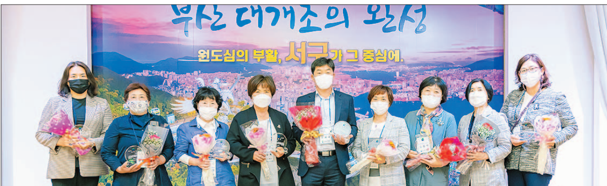
사진은 제24회 노인의 날 및 경로의 달 기념으로 마련된 노인복지 유공자 시상식 모습.