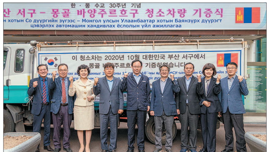
사진은 서구와 MOU단체 (사)아름다운사람들이 차량양여식을 갖고 있는 모습.

지원 차량은 내구연한이 경과한 폐기물수거용 특수차량(2.5톤)으로 부품·시트 교체 등 기본 정비를 마친 상태다. 지원 차량은 10월 말경 부산을 출발해 인천, 중국 상강, 몽골 자민우드를 거쳐 20여 일 뒤 바양주르흐구에 도착하게 된다. 서구는 당초 바양주르흐구 현지에서 차량양여식과 함께 차량 조작·정비 등 기술교육 및 선진 청소행정을 전수할 예정이었으나 전 세계적인 코로나19 팬데믹에 따라 국내에서 약식 행사를 갖고, 기술교육 등은 동영상으로 대체하기로 했다.