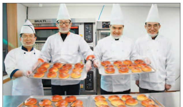
사진은 ‘꿈나라’ 제빵사와 장애인들 모습.

‘꿈나라’는 중증장애인생산품판매시설 지정으로 공공기관 직원들의 특별한 날을 위한 케이크나 행사 답례품 공급으로 장애인들의 소득향상