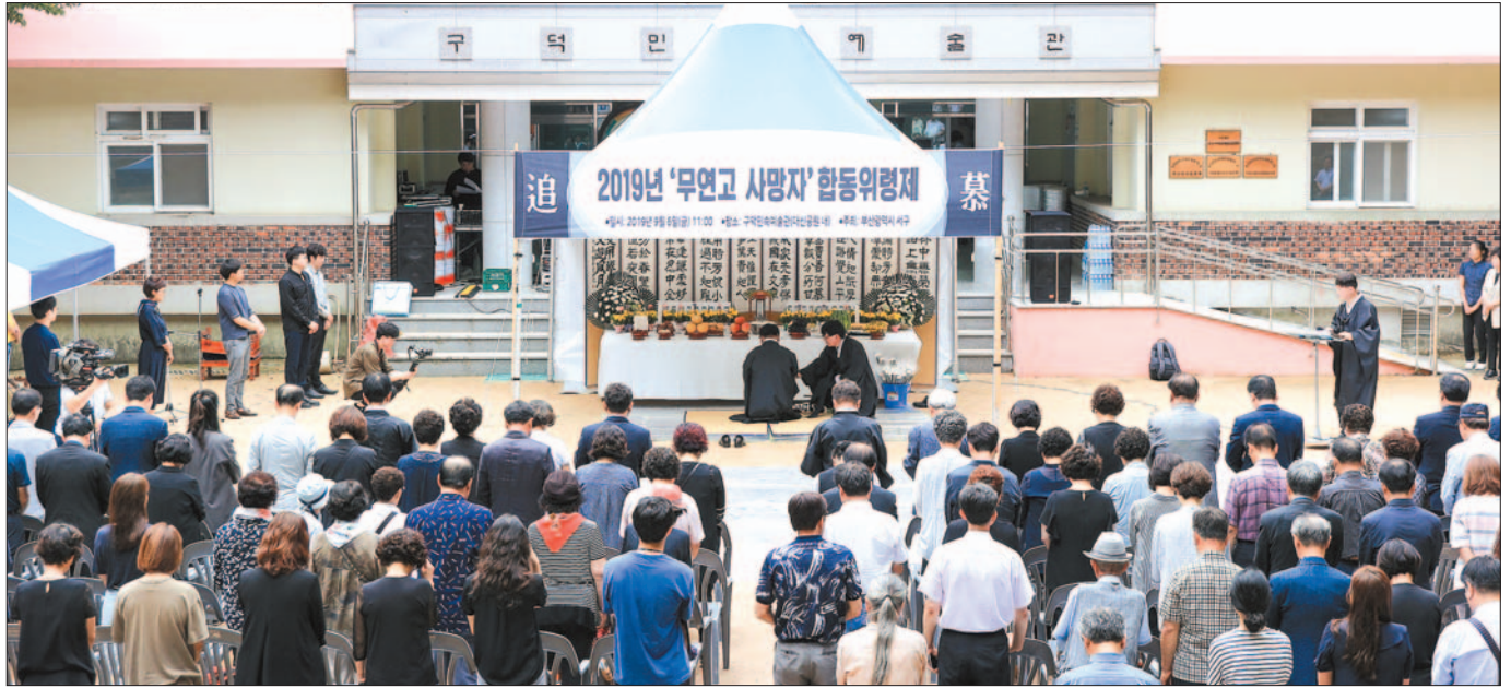
사진은 지난해 9월 전국 지자체 가운데 처음으로 구청장이 제주(祭主)를 맡아 봉행한 무연고 사망자 합동위령제 모습.

서구는 지난해 9월 전국 지자체 가운데 처음으로 구청장이 제주(祭主)를 맡아 무연고 사망자 합동위령제를 개최해 호평을 받은 바 있는데, 이번에는 관련 조례를 제정함으로써 체계적으로 시행할 수 있는 제도적 장치를 마련한 것이다. 공영장례 지원 대상은 소외계층(수