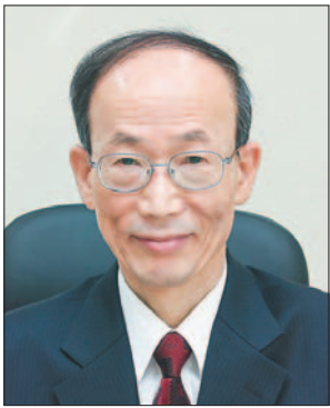
조 무 제