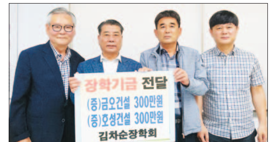
사진은 김차순장학회 장학기금 전달식 모습.