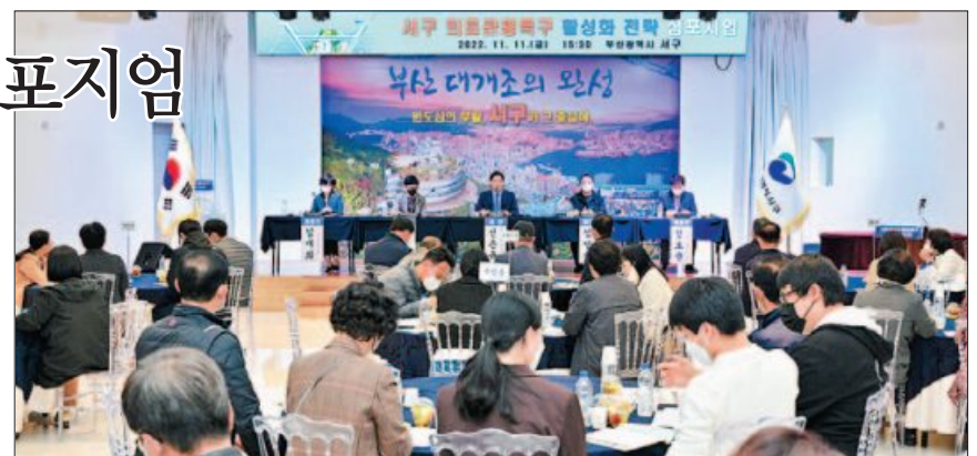
사진은 지난 11월 11일 개최된 ‘서구 의료관광특구 활성화 전략 심포지엄’ 모습.