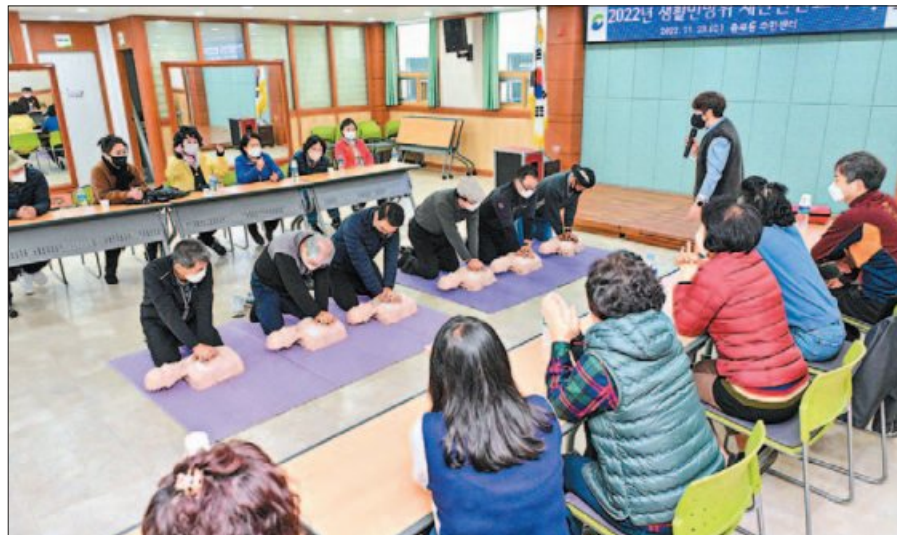
사진은 지난 11월 23일 충무동에서 실시된 주민 대상 심폐소생술 교육 모습.

서구는 우선 응급상황에 대한 공직자들의 초기 대응능력 향상을 위해 전 직원을 대상으로 심폐소생술 등 응급처치 교육을 실시하고 있다. 11월 24일과 11월 30일에는 서구가족센터, 서구보건소, 부민노인복지관 직원과 지역주민 등 200여 명을 대상으로 심폐소생술 및 자동심장충격기(AED) 사용법에 대한 교육을 진행하고 있다. 이날 교육은 중부소방서 CPR교관과 동아대학교 응급의학과 전공의 등을 강사로 이론과 실습을 병행해 실시했는데 내년 2월에는 구청 전 직원으로