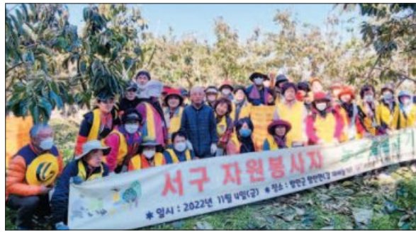
사진은 농촌일손돕기에 나선 서구자원봉사센터 봉사자들.

이에따라 서구자원봉사센터는 2014년부터 각 동에 지역캠프를 설치·운영하고 있다. 누구나 집 가까이에서 쉽게 자원봉사 정보를 얻고 참여할 수 있도록 접근성을 강화함으로써 자원봉사활동을 활성화하고 자원봉사문화를 확산시키기 위한 것이