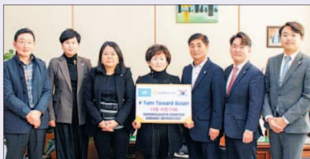
사진은 ‘턴투워드 부산’ 챌린지에 동참한 서구의회 의원들 모습.

서구의회는 ‘유엔참전용사 국제 추모의 날’을 이틀 앞둔 지난 11월 9일 ‘턴투워드 부산’ 챌린지에 동참했다. ‘부산을 향해’라는 의미의 ‘턴투워드 부산’은 6.25전쟁 당시 대한민국을 지켜낸 유엔군 전사자들의 희생과 공헌을 기리기 위해 참전 22개국을 비롯한 전 세계에서 11월 11일 오전 11시 일제히 부산을 향해 1분간 묵념하는 행사이다.