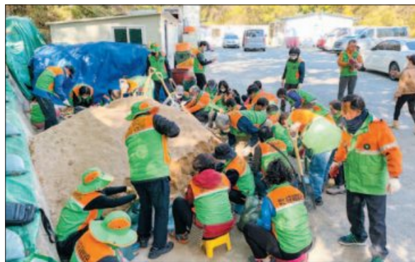
사진은 서구지역자율방재단이 모래주머니를 만들고 있는 모습.

이날 만든 모래주머니는 총 625개(개당 8kg)로 민방위교육장에 비축해 놓고 옮겨올 한파·폭설 등 재난상황 발생 시 요긴하게 쓰이게 된다. 자율방