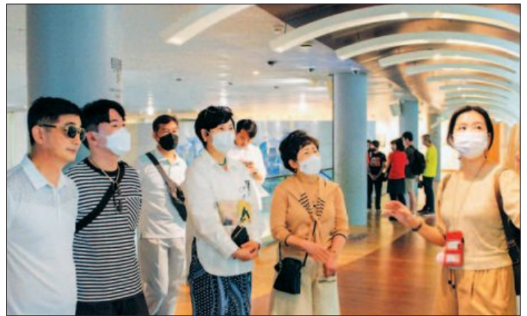
사진은 말레이시아 말라카소방서(사진 왼쪽)와 싱가포르 URA도시계획센터를 방문한 서구의회 의원들 모습.