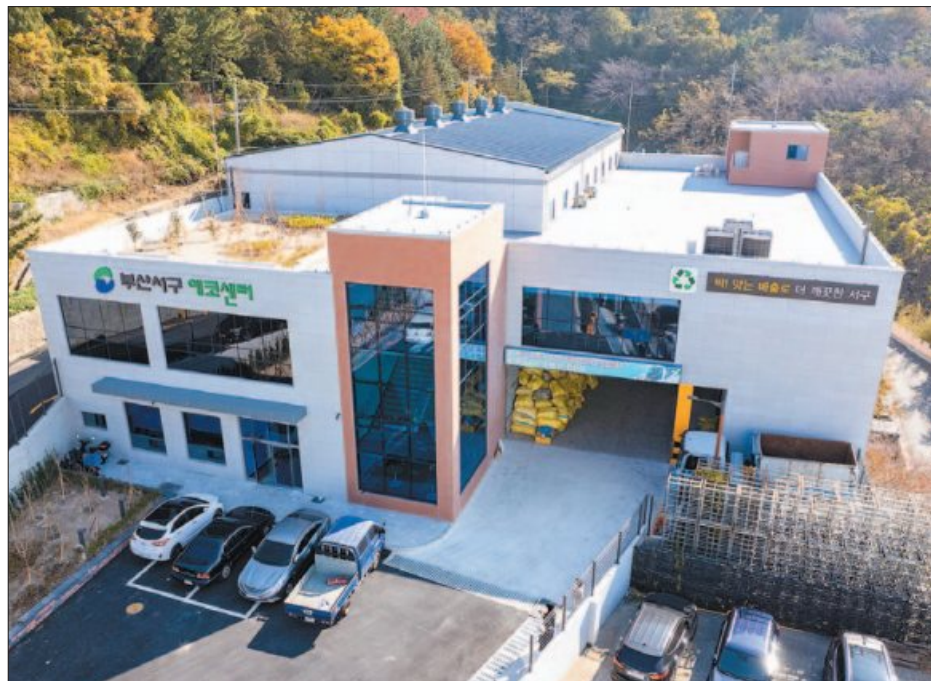
사진은 왼쪽부터 시계방향으로 암남동 옛 종합환경단지 자리에 새로 건립된 서구에코센터, 2층 수선별실 재활용품 선별 모습, 자원순환홍보관 재활용 가능 여부 체험 모습.