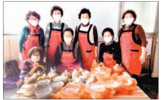
사진은 서구여성자원봉사회 회원들 모습.