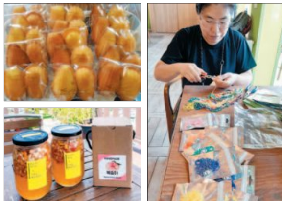
사진은 기차집카페 체험 프로그램 운영 모습과 판매 먹거리들.