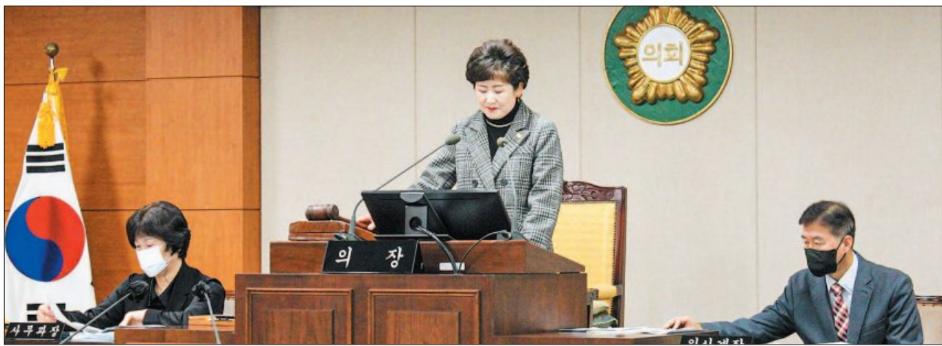
사진은 지난 11월 21일 개최된 제269회 서구의회 제2차 정례회 제1차 본회의 모습.