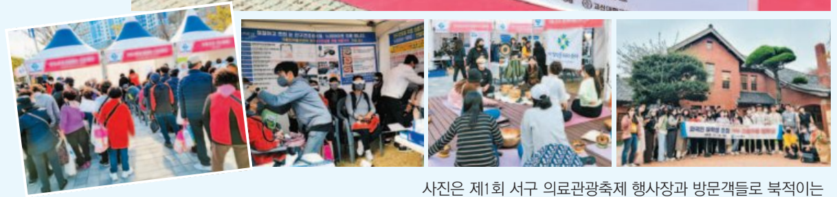
사진은 제1회 서구 의료관광축제 행사장과 방문객들로 북적이는 체험부스, 외국인 유학생 초청 의료관광 팸투어 모습.