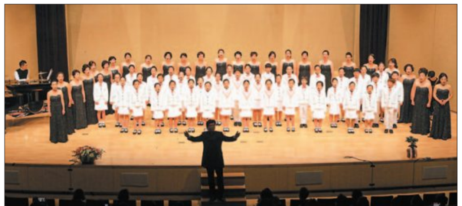
사진은 2019년 서구 여성·소년소녀합창단 정기연주회 모습.