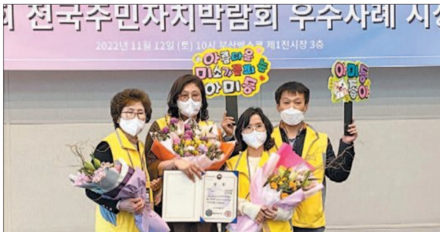
사진은 전국주민자치박람회회에서 행안부장관상을 수상한 아미동 주민자치위원회 관계자들.

기 일본인 공동묘지였던 곳에 새 삶의 터전을 일구면서 형성된 아미동은 노후 주택이 밀집한 고지대 마을로 노인과 저소득층의 비율이 매우 높다.