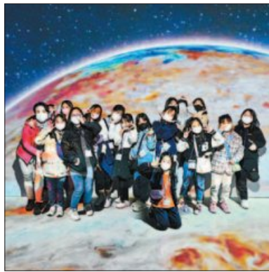
사진은 동신초등학교 학생들이 구덕문화공원 내 ‘숲속놀이터’ 미디어아트관(사진 왼쪽)과 구청 CCTV관제센터에서 구정체험 활동을 하고 있는 모습.

지난 10월에는 동신초등학교 4학년 1~3반 학생 81명을 대상으로 사흘간 각 반별로 구덕문화공원 내 새로 조성된 어린이 복합문화공간 ‘숲속놀이터’와 목석원예관, 교육역사관, 구청 CCTV관제센터와 민원실, 구의회 등에서 진행됐다.