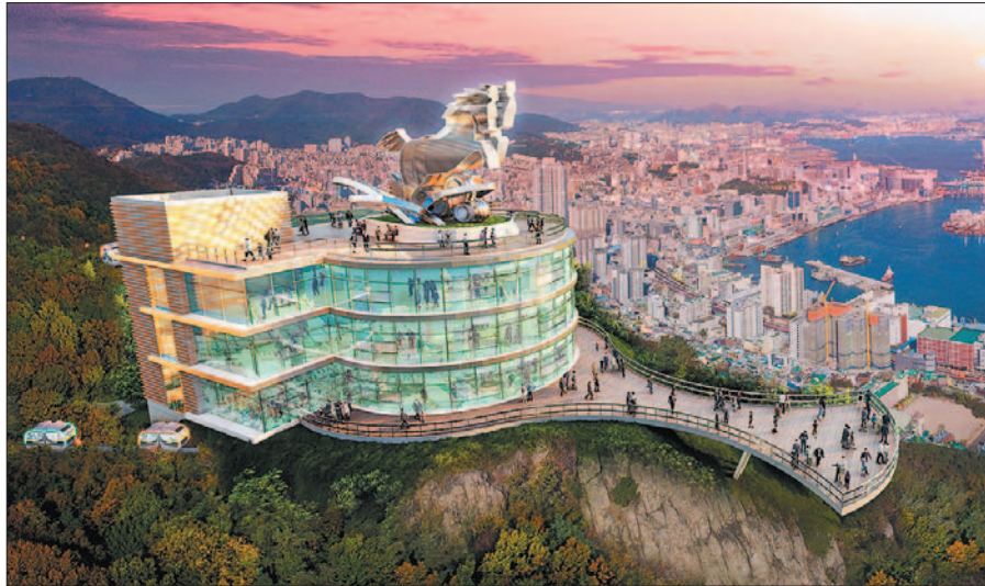
사진은 천마산 복합전망대와 스카이워크 조감도.

데크 전망대 2개소를 만들고, 천국의 계단, 초승달 모양의 조형물 등으로 포토존 4개소를 설치해 방문객들이 멋진 추억을 남길 수 있도록 할 계획이다.