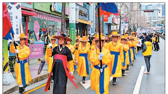
사진은 지난 3월 1일 개최된 제2회 서구와 함께하는 3.1운동 기념행사 모습. 오른쪽 위 사진부터 5개 단체 대표들의 서구민 선언문 낭독, 만세삼창, 그리고 참가자들이 구덕운동장에서 동아대학교 부민캠퍼스까지 만세행진을 하고 있는 모습.