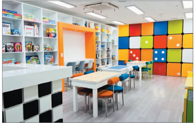
사진은 서구장애인복지관 1층에 마련된 ‘보드랑 11호점’ 내부(사진 오른쪽)와 보드게임을 즐기고 있는 모습.

하고 있으며, 향후 보드랑 대항전 개최, 보드게임 지도사 자격증 취득 강좌 개설 등 다양한 특화프로그램도 계획하고 있다.