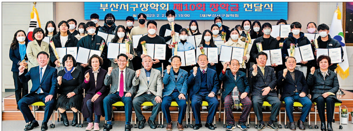
사진은 서구장학회 제10회 장학금 전달식이 끝난 뒤 참석자들이 기념촬영을 하고 있는 모습.