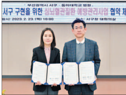
사진은 서구와 동아대병원의 업무협약식 모습.

양측은 이번 협약에서 이같은 문제점 해소를 위해 △심뇌혈관질환과 관련한 건강정보 공유 및 협약체계 구축 △고혈압·당뇨병 인지도 향상을 위한 교육·홍보·캠페인 상호협력