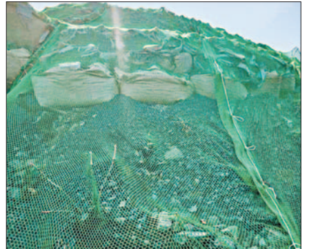
사진은 낙석방지망이 설치된 공사현장 모습.