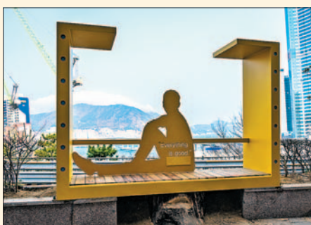
사진은 이태석 신부 테마 구간(관광고등학교)의 망고나무 모티브의 벤치조형물(사진 오른쪽)과 전망 포토존 모습.