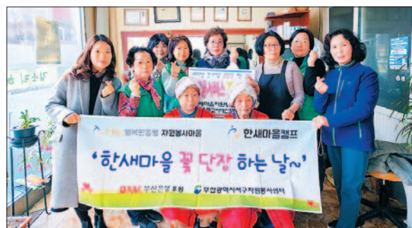
한새마을 자원봉사캠프의 이·미용 재능기부 모습.

미용실을 운영하는 회원 3명은 취약계층 어르신들에게 파마를 하고, 다른 회원들은 그 사이 손마사지를 한다. 목공예에 재능 있는 회원이 나무화분을 만들면 꽃집 운영 회원이 식물을 심어 흙뽀여르신 등에게 반려식물로 선물한다. 어버이날에는