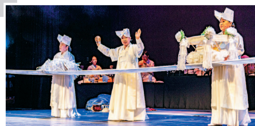
사진은 국가무형문화재 ‘진도씻김굿’의 한 장면.

2030세계박람회 부산 유치를 지지, 응원하기 위해 호남에서도 팔을 걷었다. 오는 4월 6일 오후 2시 대신공원 내 구덕민속예술관에서 펼쳐지는 국가무형문화재 ‘진도씻김굿’과 (사)대한무용협회 지정 명작무 ‘박병천류 진도북춤’이 그것이다.