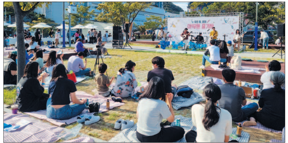
사진은 지난해 송도오션파크에서 개최된 '아!무튼 즐기자 청년축제' 모습.