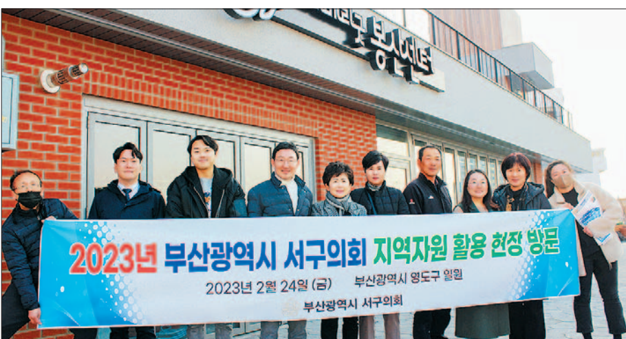
사진은 올해 첫 현장 방문으로 영도구 봉산마을(사진 왼쪽)과 전남 여수시 여수세계박람회기념관을 방문한 서구의회 의원들 모습.

특히 여수는 2012년 엑스포 개최를 통해 800만 명 이상의 방문객을 유치한 도시인 만큼 여수세계박람회기념관을 방문해 엑스포 개최 준비 과정, 성공 요인 등 운영 전반에 대해 살펴보고, 오는 11월 2030세계박람회 개최지 최종 결정을 앞두고 성공적인 부산 유치를 위한 지방의회 역할 및 지역 홍보 방안을 고민하는 시간을 가졌다.