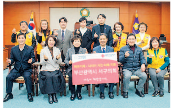
사진은 서구의회 의원들이 대한적십자사 부산지사 관계자들에게 성금을 전달하고 있는 모습.