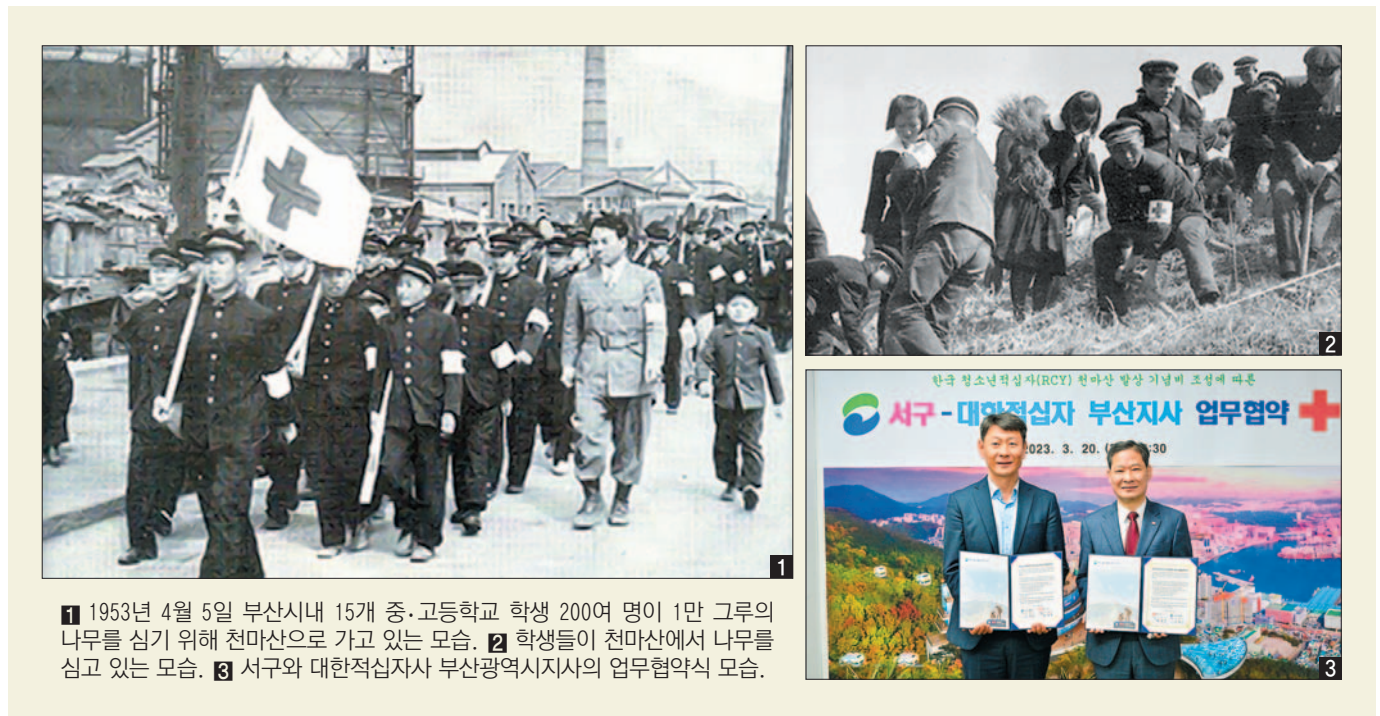
1 1953년 4월 5일 부산시내 15개 중·고등학교 학생 200여 명이 1만 그루의 나무를 심기 위해 천마산으로 가고 있는 모습. 2 학생들이 천마산에서 나무를 심고 있는 모습. 3 서구와 대한적십자사 부산광역시지사의 업무협약식 모습.

한국RCY는 6.25전쟁 막바지인 1953년 봄 세계 각국의 RCY 단원들이 전쟁으로 고통받고 있는 한국 청소년들을 위해 수십만 개의 선물상