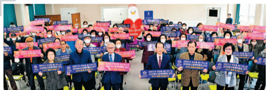
2030부산세계박람회 대한민국의 첫 번째 월드엑스포 서구가 함께 하겠습니다.