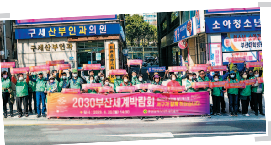
사진은 2030부산세계박람회 유치를 기원하는 대한노인회 서구지회(사진 위)와 서구새마을회의 캠페인 모습.