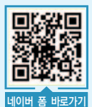
네이버 폼 바로가기