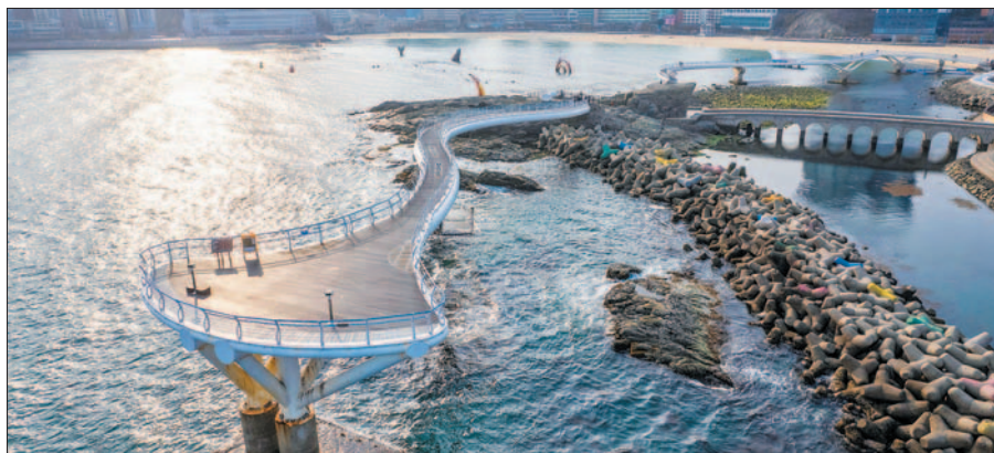
사진은 지난 3월 9일 재개방한 송도구름산책로 모습.