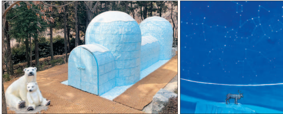
사진은 엄광산 유아숲체험원에 새로 설치된 ‘별자리 이글루’ 외부(사진 왼쪽)와 내부 모습.

엄광산 유아숲체험원에는 물놀이 마당·통나무놀이대 등 20여 종, 구덕산 유아숲체험원에는 모래놀이장, 경사 올라가기 등 9종의 다양한 숲 체험시설들이 갖춰져 있으며 총 6명의