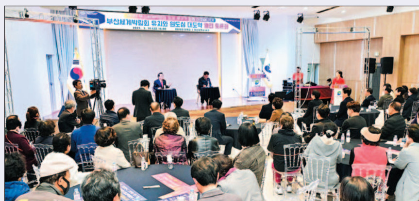
사진은 2030부산세계박람회 유치와 원도심 대도약 열린 토론회 모습.

2030부산세계박람회 유치와 원도심 대도약 열린 토론회가 지난 3월 10일 서구청 신관 다목적홀에서 개최됐다. 이날 토론회는 2030부산세계박람회(이하 박람회) 유치와 관련해 서구의 발전 방향을 모색하고 주민들과의 활발한 소통의 장을 마련하기 위한 것으로 구청장, 국회의원, 시·구의원, 주민대표 등 200여 명이 참석해 성황을 이루었다.